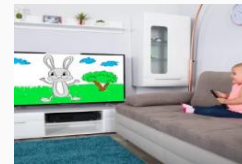
гледање цртаних филмова