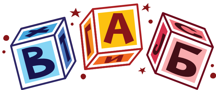
Коцке са словима

Васпитач подели деци коцке и она могу да препознају да ли су сва слова иста, колико има различитих слова, која су то слова... Затим слажу коцке по различитим критеријима: бирају коцке и слажу их тако